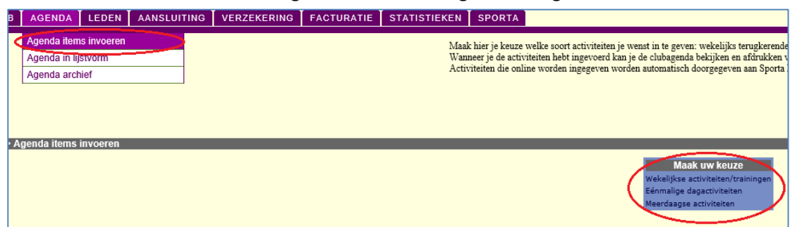
Fig.8: Keuzescherm voor ingeven soort activiteit