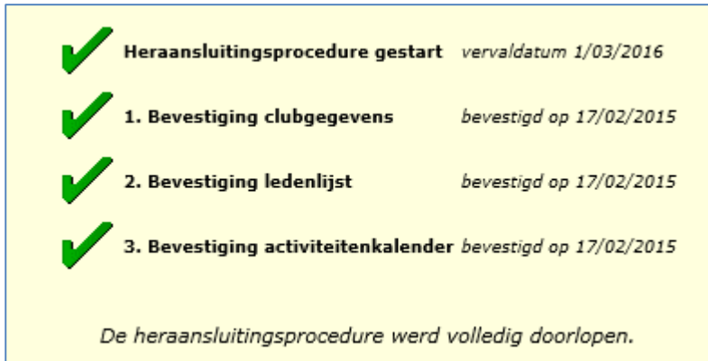
Fig.9: Afsluiting heraansluiting

Als dat zo is, heb je de heraansluitingsprocedure voor jouw club perfect afgehandeld. Het lidmaatschap van jouw club is voor het komende jaar tiptop in orde.