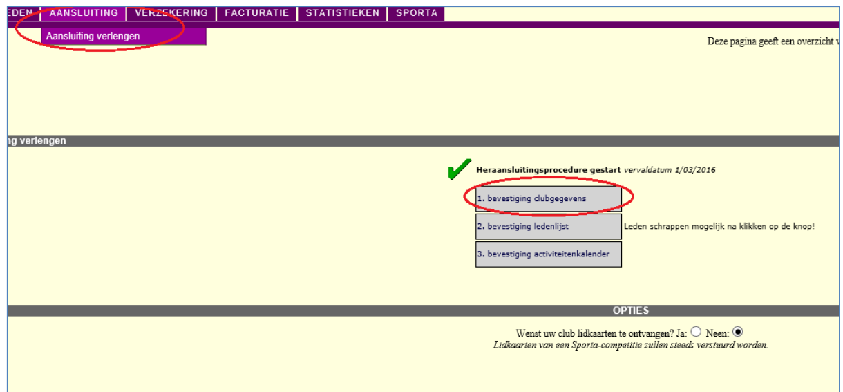
Fig.1: Overzichtsscherm heraansluitingsprocedure.